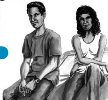
Adolescentes 13-18 años