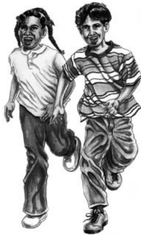
Niños/as 6-12 años