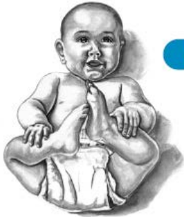
Niños/as 0-5 años